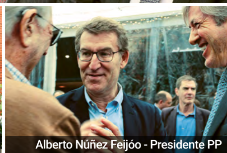
Alberto Núñez Feijóo - Presidente PP