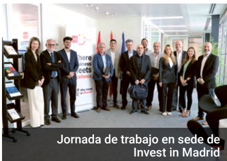
Jornada de trabajo en sede de Invest in Madrid