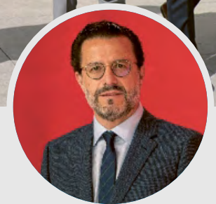
Javier Lasquetty Exconsejero de Hacienda Comunidad de Madrid

La red de empresarios españoles vinculada a nuestra organización, es una fuente invaluable de contactos en todos los sectores productivos y se convierte en una llave de ingreso a los mercados de la Unión Europea.