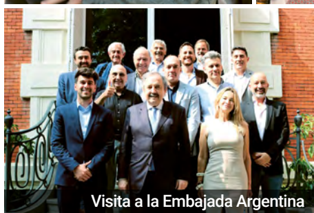
Visita a la Embajada Argentina